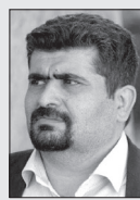
■ شبیر دائمی

باز محرم از راه رسید و پرچم های عزاداری محرم برافراشته شده اند تا خاطره واقعه کربلا را زنده نگه دارند. رنگ و رخساره شهرها تغییر کرده است. مردم آزاده جهان لباس های عزا به تن می کنند و امسال با توجه شیوع ویروس کرونا با رعایت پروتکل های بهداشتی به حسینیه ها و تکیه ها می روند تا عزاداری کنند و یاد حماسه جاویدان حسینی را گرامی می دارند. تبلیغ به عنوان کوششی سازنده در گستره ادیان، همواره مورد توجه پیامبران الهی و پیروان آنان بوده است. قرآن کریم اهمیت تبلیغ را در دعوت بشریت به هدف خلقت و اجتناب از کفر و طاغوت دانسته است. امیر مؤمنان (ع)، اهداف تبلیغی پیامبر اسلام را ابلاغ وحی، از بین بردن فاصله های اجتماعی، ایجاد وحدت، اصلاح ذات البین، دعوت به سوی پروردگار، شجاعت و پافشاری در ابلاغ حق و استفاده از حکمت و موعظه همراه با نصیحت و خیرخواهی بر شمرند. امام خمینی (ره) تبلیغ را شناساندن خوبیها و تشویق به انجام آن، ترسیم بدیها و نشان دادن راه گریز و منع از آن دانسته و آن را از اصول بسیار مهم اسلام عزیز بر شمرند. قیام عاشورا، درس دین باوری، ایثار، شجاعت، شهامت، جهاد در راه خدا، امر به معروف و نهی از منکر و روحیه ستیزه جویی پرخاش گری و جسارت در مقابل حکام جور را در مسلمانان ایجاد کرد و پیروان مکتب اهل بیت علیهم السلام، صحنه های اعجاب انگیزی از رشادت، شجاعت، فداکاری و ایثار خلق کردند. امام حسین (ع) با توجه به رسالت عظیم خود در هدایت بشر به عنوان امام جامعه، دعوت خود را از راه قیام آغاز کرد و با شهادت خود و اسارت اهل بیت (ع) بهترین شیوه