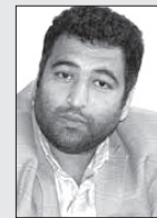
حسین پایین محلی

حکیم بزرگ ایرانی و احیاگر زبان فارسی این مواجهه رازیباسروده اگر مرگ دادست بیداد چیست ز داد این همه بانگ و فریاد چیست ازین راز جان تو آگاه نیست بدین پرده اندر ترا راه نیست همه تا در آ ز رفته فراز به کس بر نشد این در راز باز برفتن مگر بهتر آیدش جای چو آرام یابد به دیگر سرای