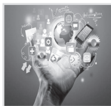
کرونا به اهالی فرهنگ و رسانه آسیب زد