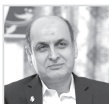
سراغه فضای آموزشی مدارس پایین تر از میانگین کشوری است