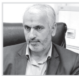
بر خورد جدی با مدعیان و کالت تضمینی