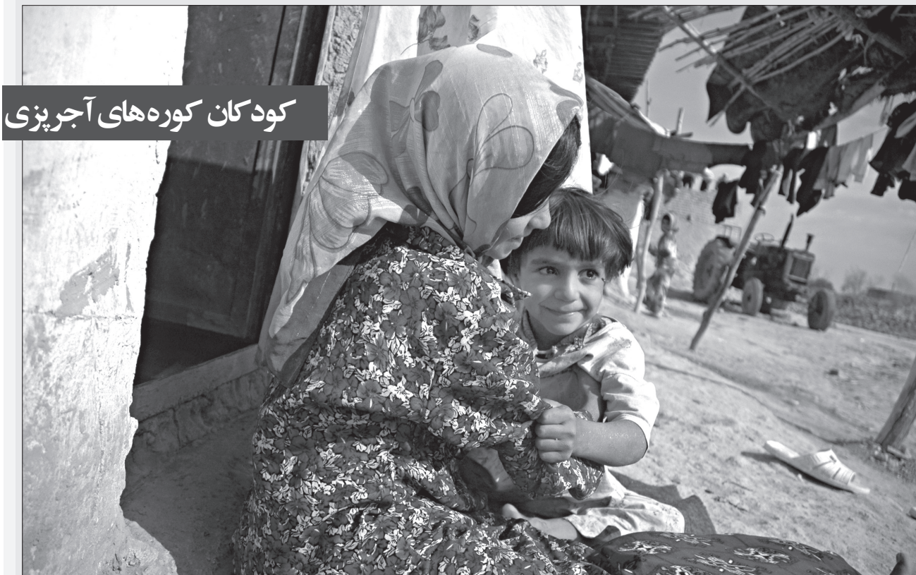
کودکان کوره های آجرپزی

رییس گروه بهبود کیفیت، فرآوری و توسعه آبریان اداره کل شیلات گلستان گفت که میگوی صید شده از مزارع این محصول در گمیشان پس از فرآوری در کارگاه های بسته بندی با رعایت الزامات فنی و بهداشتی، آماده عرضه به بازارهای داخلی و خارجی است. ارزش جیران در گفت و گو با خبرنگار خبرگزاری جمهوری اسلامی اظهار داشت: امسال ۳ کارگاه در استان عملیات فرآوری میگو را طی یک ماه و همزمان با برداشت محصول از مزرعه برعهده داشتند. به گفته وی اکنون در گلستان هشت کارگاه فرآوری میگو با ظرفیت اسمی ۶ هزار و ۵۰۰ تن در هر دوره مشغول فعالیت است. وی علت کاهش آمار فعالیت کارگاه های فرآوری میگو در استان را خسارت بیماری لکه سفید در سال قبل و کاهش شدید تولید محصول