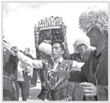
۳ وضعیت قرمز کرونا نتیجه برگزاری عروسی هادر گنبد