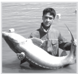
۲ انقراض ماهیان خاویاری خزر نزدیک است