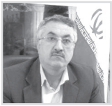
۳ پایان برداشت میگو