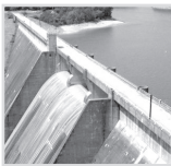
سدهای گلستان آماده آبیگری