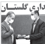
معاون سیاسی امنیتی و اجتماعی استاندار معرفی شد