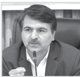
۲ اعمال محدودیت تردد بین شهری در گرگان