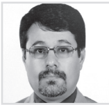
۲ انتخابات ریاست جمهوری آمریکا و ۱۰ آموزه سیاسی