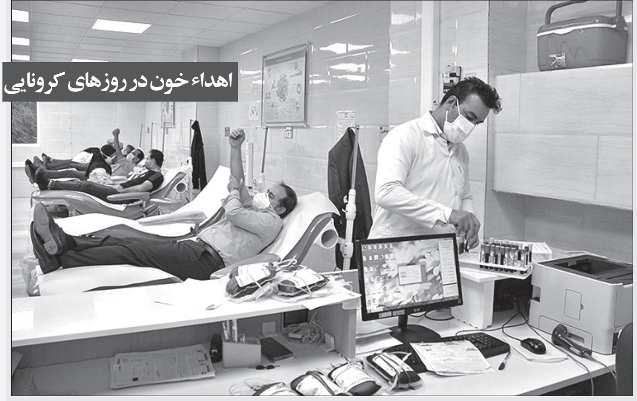
اهداء خون در روزهای کروناپی

استاندار گلستان اظهار کرد: فعالیت تمام گروه های کاری بجز موارد ضروری و مشاغلی که مایحتاج روزمره مردم را ارایه می دهند از ابتدای آذر در شهرهای قرمز تعطیل است. به گزارش روابط عمومی استانداری گلستان، هادی حق شناس ضمن تقدیر از زحمات کادر درمانی و عموم مردم تصریح کرد: هنوز کل استان به وضعیت قرمز نرسیده و چهار شهر گرگان، آق قلا، ترکمن، کلاله در وضعیت قرمز، رامیان در وضعیت زرد و باقی ۹ شهرستان استان در وضعیت نارنجی قرار دارند اما رعایت همگانی الزامی است. وی افزود: بر اساس مصوبه ستاد ملی مقابله با کرونا