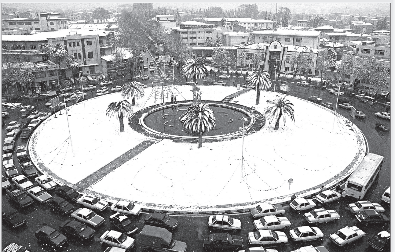
میدان شهرداری گرگان در سال ۱۳۶۴