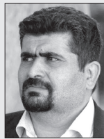
■ شبیر دائمی

نظریات و ایده ها و بدون پاداش گذاشتن ایده ها بوده و در بدترین حالت مدیران ممکن است حتی نظریات ارائه شده را نخوانند و در بهترین حالت ممکن است مدیر ارشد این نظریات را بخواند ولی با دلایل ناکافی یا مصلحت های غیرقابل توجیه اقدام به رد ایده ارائه شده بنماید. با توجه به نوع انگیزه کارکنان سکوت در سازمانها به ۳ دسته زیر قبل تقسیم بندی است: