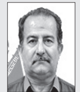
■ دکتر حسین میفانی

به جرات می‌توان ادعا کرد که انقلاب اسلامی ایران در کنار دو انقلاب دیگر یعنی انقلاب کبیر فرانسه (۱۷۸۹ - ۱۷۹۹) و انقلاب اکبر روسیه (۱۹۱۷ - ۱۹۲۳) یکی از سه انقلاب عظیم در قرون اخیر بوده است. انقلاب اسلامی از جهاتی شبیه انقلاب اکبر بوده که رهبر آن انقلاب (ولادیمیر ایلیچ لنین) با قطار از تبعید به وطن مراجعه نموده و مورد استقبال بی نظیر قرار گرفت و امام خمینی کبیر هم با هوایما از تبعید به وطن اسلامی برگشت و مردم ایران یکی از بشکوهترین استقبال‌های تاریخ را رقم زدند و از فرودگاه تا بهشت زهرا با دسته‌های گل از رهبرشان استقبال کردند. در ابتدای انقلاب که تمامی گروه‌های شرکت کننده در انقلاب برای یک هدف گرد هم آمده و آن هدف سرنگونی رژیم سفاک پهلوی بود که بعد از پیروزی انقلاب صف بندیها بین گروه‌های انقلابی ایجاد شده و حتی کار به جایی رسید که بعضی از این گروه‌ها در برابر حکومت تازه تشکیل شده اعلام جنگ مسلحانه نمودند که باز خوانی این ماجرا مورد نظر نگارنده نبوده بلکه قرار است که ماجرا از دیدگاهی دیگر مورد بررسی و توضیح و تفسیر قرار گیرد و آن همانا مورد سوال و جوابگویی قرار دادن