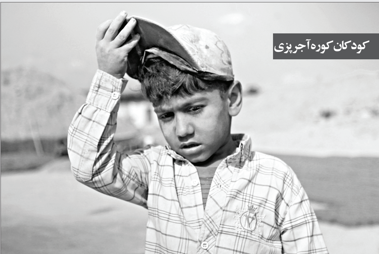
کودکان کوره آجرپزی

با ورود سامانه سرد و بارشی به گلستان شاهد بارش برف در محورهای کوهستانی بوده و تردد در این جاده ها با زنجیر چرخ ممکن است. سامانه سرد و بارشی که از چهارشنبه وارد گلستان شده بود، سبب بارش پراکنده باران در سطح استان شده و ارتفاعات کوهستانی را سفیدپوش کرد. مدیرکل هواشناسی گلستان گفت: با نفوذ سامانه سرد سیبری شاهد بارش باران در اکثر مناطق استان هستیم. نوریخش داداشی افزود: به دلیل برودت هوا علاوه بر ارتفاعات استان، در نواحی کوهپایه ای و کوهستانی هم ریزش ها به صورت مخلوط برف