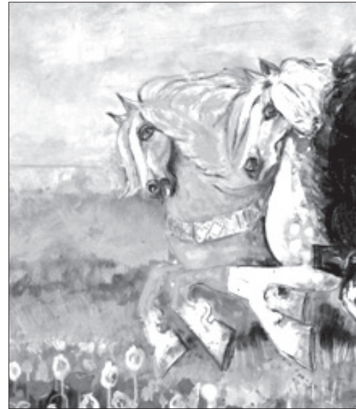
در راستای فراخوان جشنواره هنر و بیان، داستان های که به ترتیب هر هفته برخی از آن ها را با هم می خوانیم.