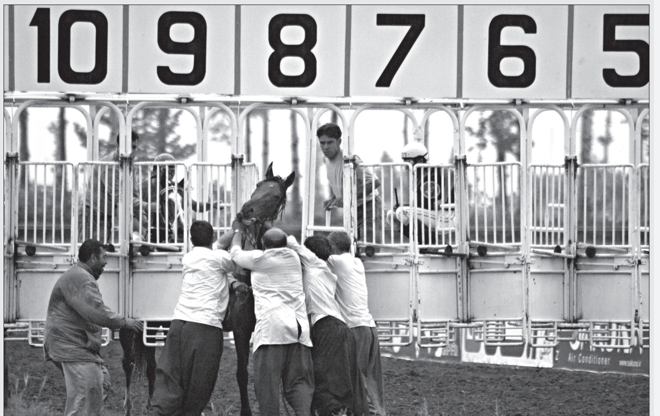
کورس اسپورتنی گنبدکلوکروس