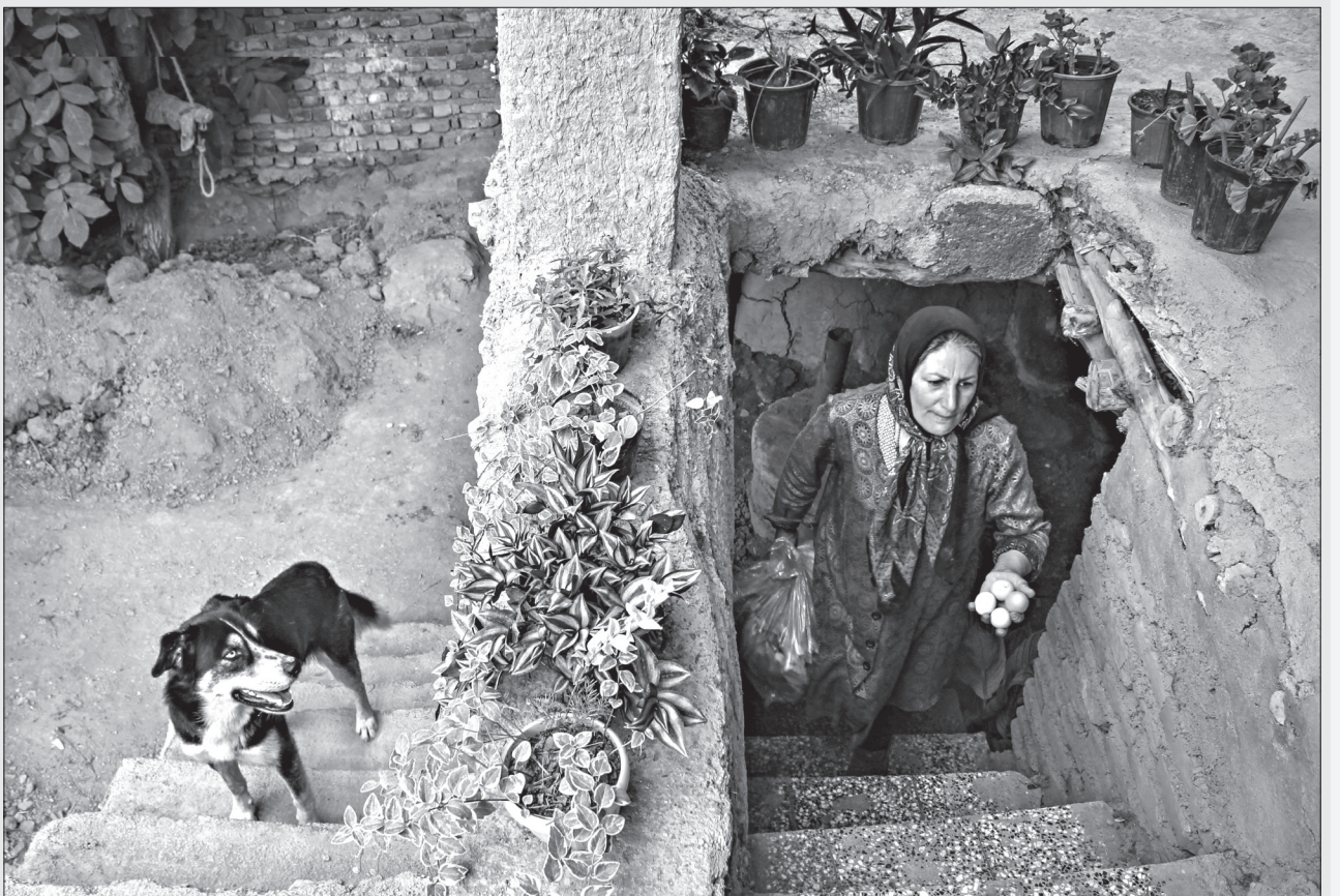
روستای شاهکوه / عکس: وحید گنجی

استاندار گلستان با تاکید بر اهمیت تحکیم روابط دو کشور ایران و قزاقستان اظهار کرد: پرواز گرگان به اکتائو برقرار خواهد شد و اولین سفر هوایی بین این دو شهر ۱۲ فروردین سال ۱۴۰۰ انجام می شود. به گزارش روابط عمومی، هادی حق شناس در دیدار با "با ایدجان ایداشف" سرکنسول قزاقستان در گرگان گفت: پس از