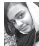
سبامانذرانی. کلاس هشتم

هر فرد در زندگی خود باید هدف داشته باشد تا در راستای آن قدم بردارد و برای رسیدن به هدف باید تلاش کند. همه انسان ها می دانند ولی عمل نمی کنند. اگر شخصی هدف نداشته باشد، گمراه می شود و سرعت عمل کافی برای به انجام رساندن امور را نخواهد داشت. اهداف ممکن است برای هر فردی به شکل های مختلف باشد. هر کس در سنی هدف های گوناگونی دارد. برای ایجاد هدف به نظرم باید رقابت وجود داشته باشد تا بهترین باشیم. اگر رقابت وجود داشته باشد هر فردی دوست دارد بهترین باشد و برای رسیدن به آن هر کاری انجام می دهد.