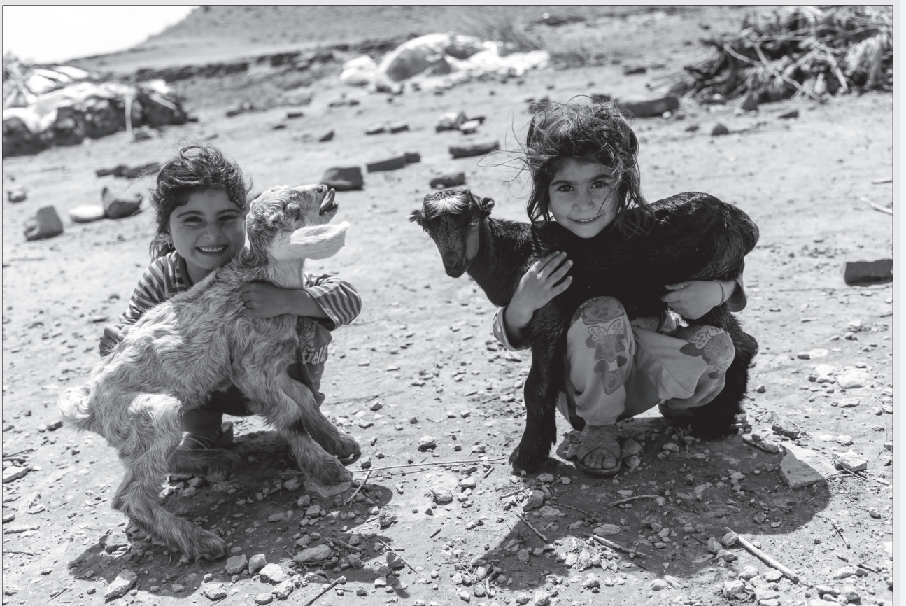
شادی کودکان روستا: جدیدته پاستوری

گلشن مهر - ورزش کبدهی یا همان زو یک بازی ایرانی است که منشأ این بازی بومی محلی بوده. از این رو قوانین کبدهی به مرور زمان دچار تغییرات مختلفی شده است و افراد بسیاری به عنوان ورزش حرفه ای آن را دنبال میکنند و علاقه مندان، تیم ها، لیگ ها و تورنمنت های بزرگی را به راه انداختند و قطعا این رشته ی