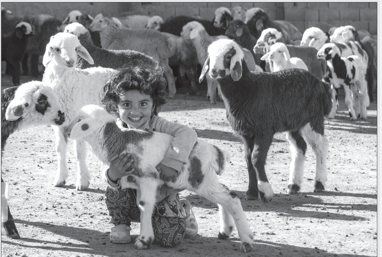
عشایر کرچمنه گرمانج در دشت های ترکمن صحرای گلستان