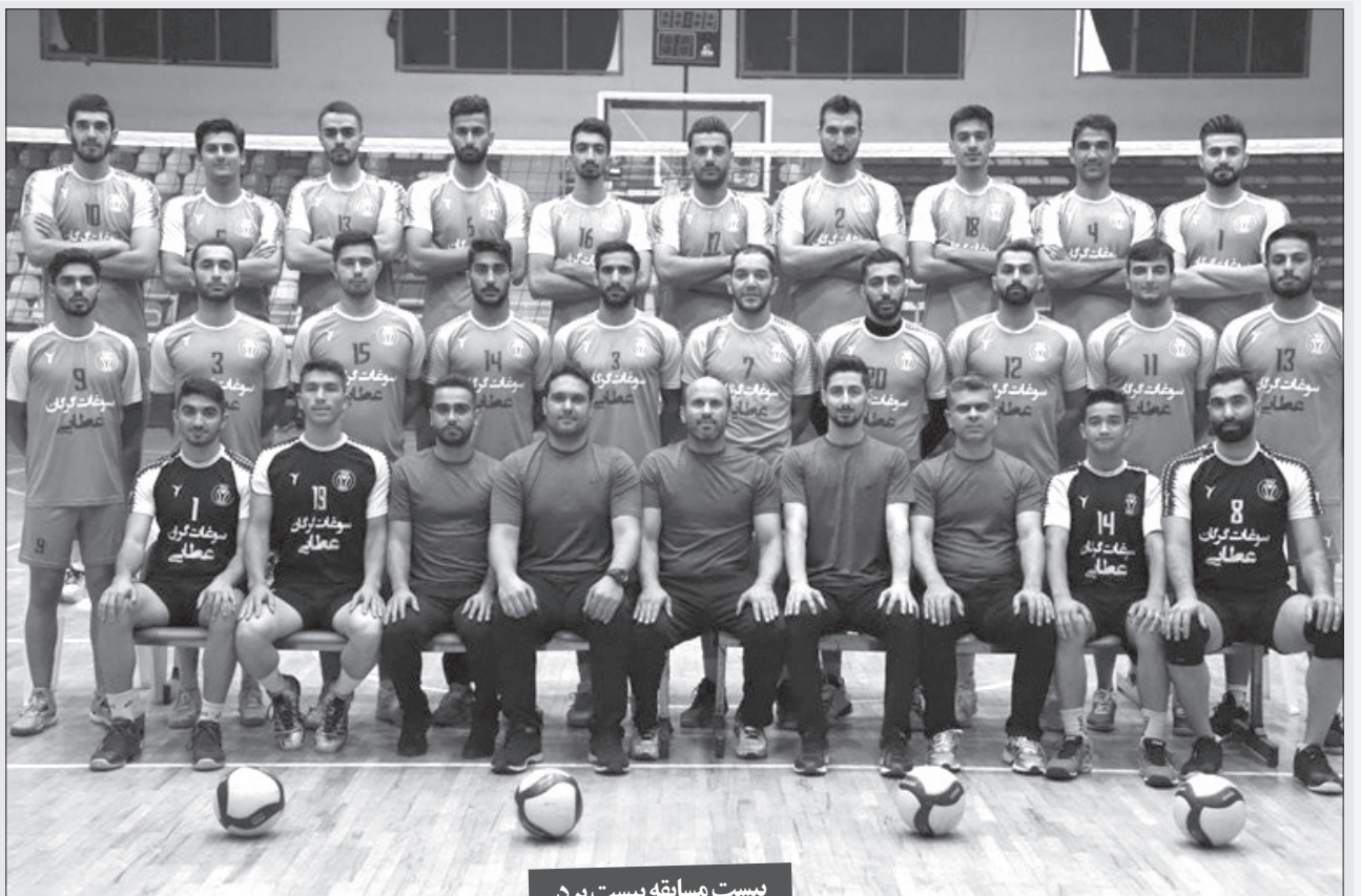
بیست مسابقه بیست برد