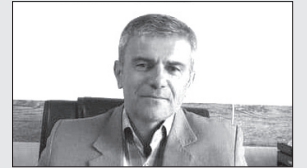
سرپرست منابع طبیعی و آبخیزداری گلستان گفت: در ۱۱ ماهه امسال ۲۹۱ فقره پرونده تخریب و تجاوز برای ۲۶۳ هکتار از منابع طبیعی گلستان تشکیل