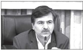
پلمب ۳۹ واحد صنفی در گرگان

فرماندار گرگان از پلمب ۳۹ واحد صنفی در این شهرستان خبر داد و گفت: نظارت بر اصناف در ماه رمضان افزایش می‌یابد. محمد حمیدی در جلسه ستاد تنظیم بازار شهرستان اظهار کرد: با توزیع روزانه بیش از ۶۰ تن مرغ گرم جلوی تشکیل صف‌های طولانی گرفته شد و اکنون که بازار در آرامش نسبی قرار دارد با توزیع روزانه بیش از ۲۳ تن مشکلی بابت تأمین مرغ گرم در سطح شهرستان وجود ندارد. فرماندار گرگان افزود: در ۵۰ روز گذشته با توزیع اقلام تنظیم بازار شامل، ۸۹ تن مرغ گرم، ۲۱۰ تن برنج، هزار و ۵۶ تن روغن و ۹۰ تن قند و شکر، مشکلی بابت تأمین این اقلام در ایام نوروز و غیره در سطح شهرستان وجود نداشته است. وی گفت: در بازدید از پنج هزار مکان تولید و عرضه مواد غذایی در ۵۰ روز گذشته، به دلیل وجود مواد غذایی فاسد ۳۹ واحد پلمب و ۶۵ مورد هم به مراجع قضایی معرفی شده‌اند. حمیدی تأکید کرد: با توجه به فرارسیدن ماه رمضان، مرکز بهداشت، اداره اماکن نیروی انتظامی و سازمان صمت نسبت به تأمین و توزیع اقلام تنظیم بازار، نظارت بر رعایت شیوه نامه‌های بهداشتی و همچنین نظارت بر رعایت نکاتی شرعی در این ایام اقدامات لازم را انجام دهند.