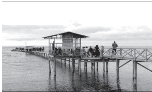
محیط زیست نیز از آن به عنوان پناهگاه حیات وحش حفاظت می‌کند.