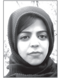
گلشن مهر/کوثرقندهاری ۱۶ فروردین الی ۱۶ اردیبهشت، ماه جهانی آگاه سازی اوتیسم می باشد که هرساله اقدامات بسیاری به همت انجمن