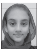
■ پاریس فدوی. پایه هفتم

با آمدن بهار سفره هفت سین بر پا شد. عمو نوروز که آمد؛ درختان چتر خود را باز کردند. قبل از این که بهار بیاید پرند ه ها به ما پیام بهار را می دهند. همه خوشحالیم که بهار آمد و دوباره کنار هم هستیم. درختان شال سفید و صورتی به سر دارند. بهار مادر سه فرزند است: اسم فرزندان فروردین، اردیبهشت و خرداد است.