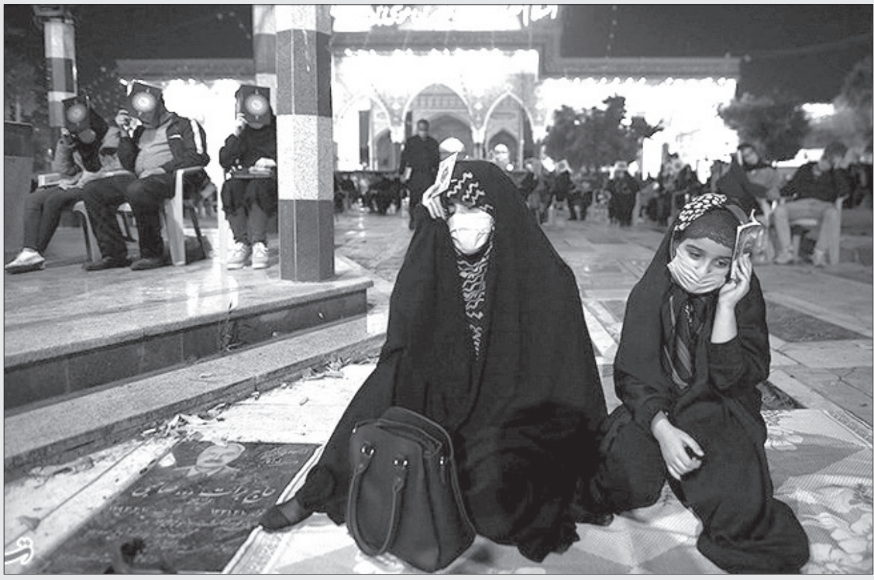
شب قدر در گرگان