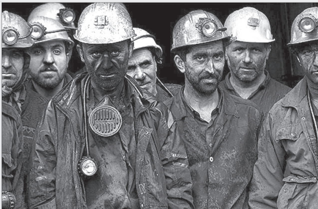
کارگران معدن زمستان بورت

از این بیماری نیز اشاره کرد و گفت: طی هفته گذشته ۳۲ مورد فوتی کرونایی داشتیم که این تعداد در هفته قبل از آن ۴۰ مورد بوده و پیش بینی می کنیم در هفته جاری نیز میزان مرگ و میر ناشی از این بیماری روند کاهشی داشته باشد. فاضل در ادامه بیان کرد: بر اساس آخرین ارزیابی صورت گرفته از سوی وزارت بهداشت، شهر کلاله در وضعیت قرمز، شهرهای گرگان، بندرگز، کردکوی، علی آبادکتول، آزادشهر، مینودشت و گالیکش در وضعیت نارنجی و شهرهای گنبدکاووس، بندر ترکمن، آق قلا، گمیشان، رامیان و مراوه تپه در وضعیت زرد از نظر شیوع