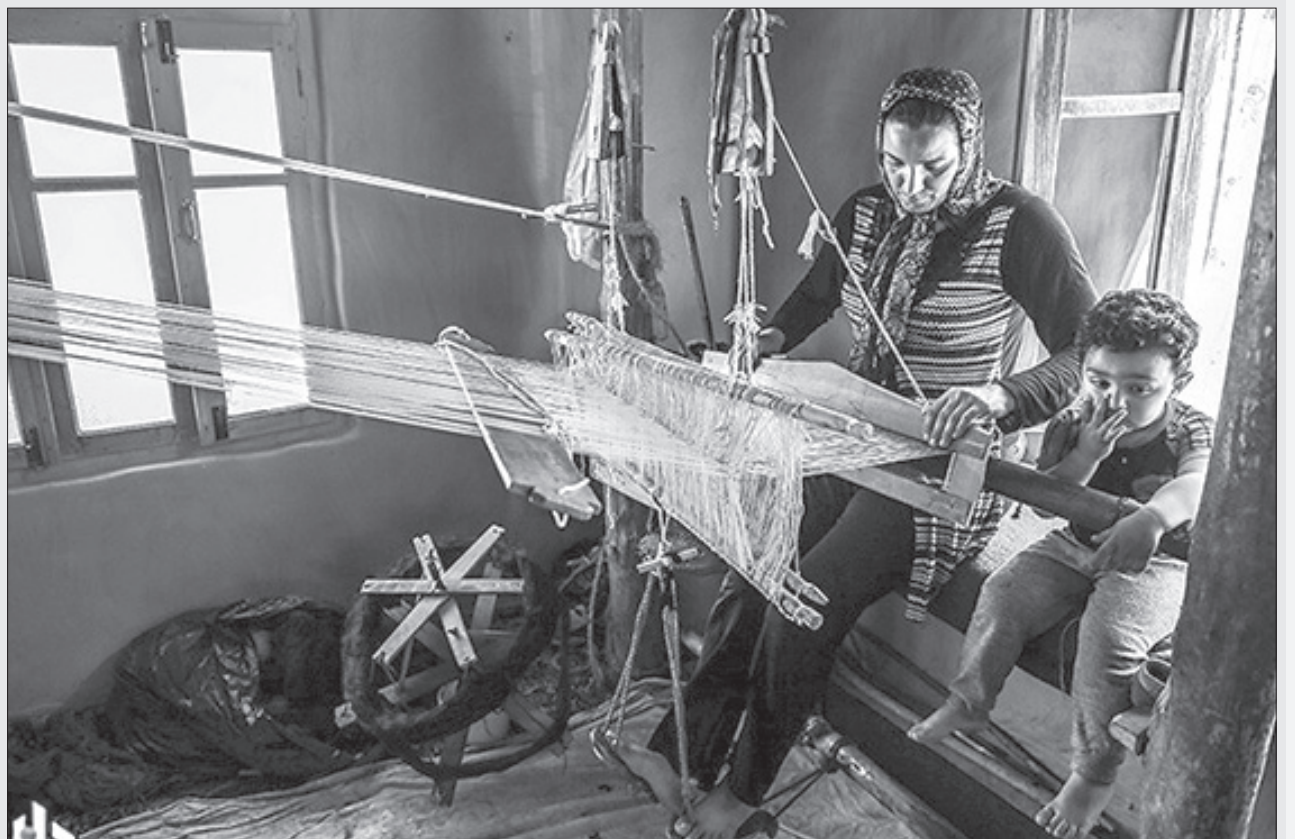
بازارچه صنایع دستی در زاهدان