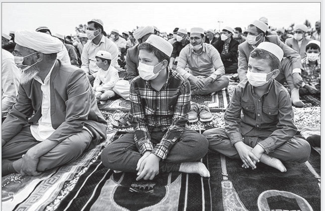
آقامه نماز: عید سعید فطر در بندر ترکمن

جمعی از کشاورزان آق قلایی نسبت به تخصیص نیافتن آب برای اراضی پنبه کاری خود در شبکه سد وشمگیر معترض هستند و عنوان می کنند که اگر نتوانند مزارع خود را آبیاری کنند، محصولات آنها از بین رفته و با فاجعه روبه رو می شوند. به گزارش ایسنا، اعتراضات نسبت به این موضوع در حالی مطرح می شود که طبق اعلام مسئولان شرکت آب منطقه ای، استان گلستان