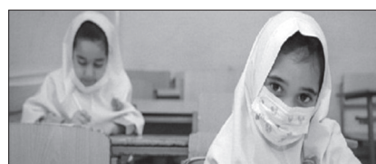
مدارس موظف هستند تمام شیوه نامه ها را برای حفظ سلامت دانش آموزان، رعایت کنند. تربیتی نژاد در بخش

دیگری از سخنان خود گفت: ثبت نام پایه اولی ها اینترنتی بوده و نیازی به مراجعه حضوری نیست. مدیر آموزش و پرورش شهرستان گرگان همچنین با اشاره به تأثیرات کرونا بر تحصیل دانش آموزان، بیان کرد: در گرگان هزار و ۸۰۰ دانش آموز به مدرسه مراجعه نکردند که ۷۰۰ نفر آن ها به عرصه تحصیل برگشتند. طبق گفته وی حدود هزار دانش آموز بازمانده از تحصیل در شهرستان گرگان وجود دارد.