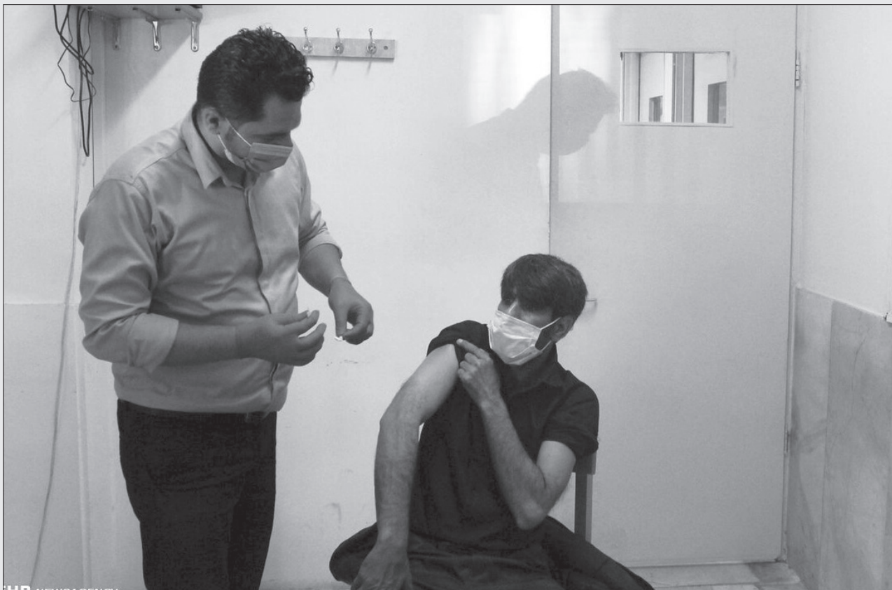
تزریق واکسن کرونا به بیمار خان خاص

مسئول بخش زنبور عسل جهاد کشاورزی گلستان با بیان اینکه سالانه در کشور به ۵ میلیون ملکه زنبور عسل نیاز داریم، گفت: بخشی از نیاز زنبورداران با ملکه های قاجاق خارجی برطرف می شود که این مسئله خطر ایجاد بیماری های مختلف را افزایش می دهد. اگر در کشور از مراکز اصلاح نژاد حمایت کنیم، می توانیم تمام نیاز کشور را تامین کنیم. بشبیر بصیری با اشاره به وجود