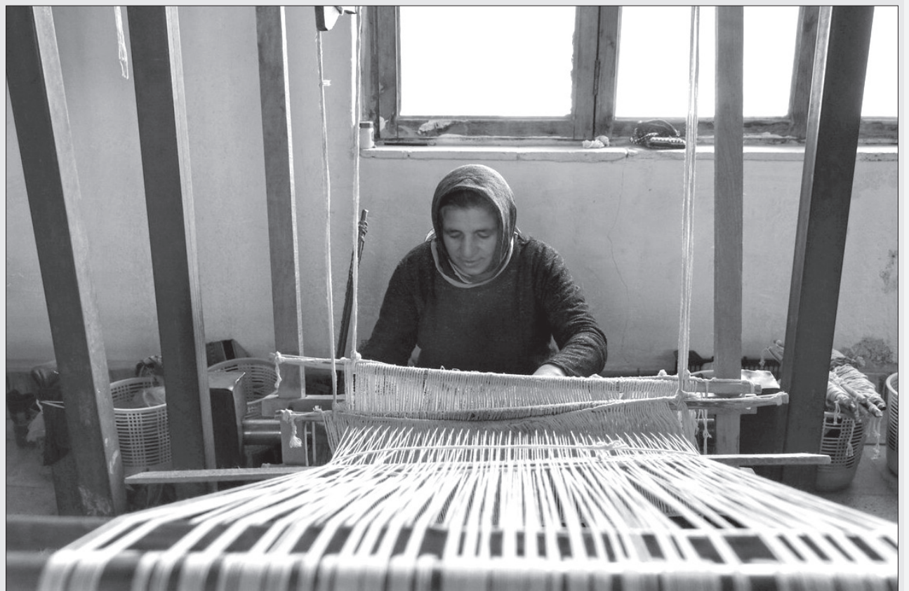
تولید پارچه در زیارت

مدیرکل گمرکات گلستان گفت: با وجود بسته بودن مرز زمینی اینچه برون از سوی ترکمنستان، از ابتدای امسال تاکنون ۲۲ میلیون دلار انواع کالا از طریق راه آهن گلستان به کشورهای دیگر صادر شد. به گزارش روابط عمومی گمرک گلستان، سیدابراهیم حسینی اظهار داشت: عمده کالاهای صادراتی گلستان از طریق ریلی و پایانه های صادراتی