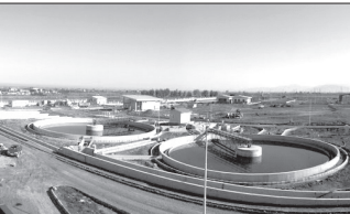
خط دوم تصفیه خانه فاضلاب گرگان بهره برداری شد

خسارت وارده به استان در جریان سیل روزهای آغازین سال ۹۸ علاوه بر مرگ ۱۱ شهروند، مجموع ۴۸ هزار میلیارد ریال بوده است.