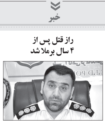
راز قتل پس از ۴ سال بر ملا شد