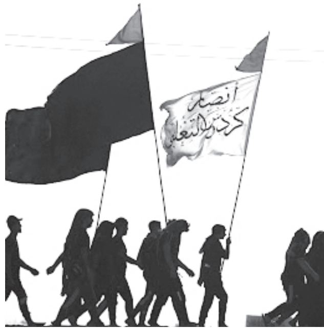
مراسم پیاده روی جاماندگان اربعین حسینی با رعایت کامل شیوه‌نامه‌های بهداشتی از مساجد به سمت امامزاده‌ها و قبور شهدای گمنام استان برگزار می‌شود.

در آستانه بیستم صفر، ارادتمندان حسین و مشتاقان حضور در پیاده روی اربعین با برپایی موبک جاماندگان در گرگان، شمه ای از عشق و مودت خود به قافله سالار دشت کربلا را به نمایش گذاشتند. به گزارش مهر، همه به عشق حسین آمده اند، پیر و جوان و زن و مرد. در دل‌هایشان غوغاست؛ از دیدار کوی دوست جا مانده و نجوای ناکفته فراوان دارند. اینجا خیابان شهید رجایی گرگان؛ جایی که معبر عاشقان گسترده شده تا شاید مرهمی بر بی قراری‌های دلدادگان حسین (ع) باشد. صدای مداحی بلند است و موبک داران مردم را صرف چای عراقی و شربت دعوت می‌کنند؛ فضا با عطر اسپند پر شده و نورهای رنگی عجیب آدم را به یاد بین الحرمین می‌اندازد. ۶۰ موبک عشق برای جاماندگان اربعینی به صورت نمادین برپا شده و موبک داران سعی می‌کنند تا گوی خدمت را از یکدیگر برپایند. محدودیت‌های کرونایی پیاده روی اربعین ۱۴۴۳، مانع حضور میلیون‌ها زائر به کربلا شده اما مغناطیس عشق حسین همه را جذب کرده و دل‌ها روانه مأمین عاشقان است. در گوشه‌ای از خیابان شهید رجایی، جوان حدوداً ۱۸ ساله مشغول واکس زدن برای عاشقان حسین است، آن سوتر موبکی برای خیاطی برپا شده و در دیگر سو خدمتی دیگر و عشقی دیگر. مرد میانسالی با خود خلوت کرده و در حال نوحه سرایی است؛ با بغضی در صدا یا حسین گویان می‌گوید: اشک ما جاماندگان هم خربلدار دارد و به رفته و رفته‌ها به یک چشم نگاه خواهد شد.