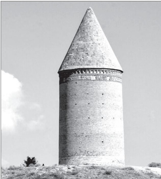
بدنه میل رادکان از آجر ساخته شده و آجرهای آن از نظر پختگی، رنگ و استحکام مانند آجرهای میراث جهانی گنبد قابوس است.

کاربردهایی همچون قصر، مقبره، گنبد و برج را بیان کرده‌اند اما تا زمان خواندن تمام کتیبه‌های این بنا برای قطعیت این موضوع، باید منتظر بود. تاکنون بر اساس متن‌های قرائت‌شده برخی از این کتیبه‌ها، گفته شده است که بنای رادکان متعلق به یکی از اسپهبدان آل‌باوند تبرستان به نام ابو جعفر محمد ابن وندریان بوده است و این گنبد مدفن او است. بر کتیبه‌ای که در زیر گنبد دیده می‌شود، ساخت آن در سال ۴۰۷ هجری قمری ذکر شده است. این بنا از دو قسمت گنبد و بدنه تشکیل شده است. گنبد آن به‌صورت ترک (مخروطی شکل) و دو پوسته است که بیش از ۳۵ متر ارتفاع دارد. بدنه بسیار ساده و دارای آجرچینی معمول و دارای تزئینات آجرکاری و گچ‌بری است. به‌منظور استحکام‌بخشی بیشتر حداثی بندهای آجرها با فشار انگشت دست به داخل فشرده شده که قابل توجه است. زیباترین قسمت بنا در بخش فوقانی آن قرار دارد که عبارت از دو ردیف قطار بندی و دو کتیبه کوفی و پهلوی است، در میان تزئینات آجرکاری و گچ‌بری نام بانی و تاریخ ساخت بر آن نوشته شده است. طرح داخلی گنبد رادکان مدور و دارای نمایی ساده از گچ و آهک است. در تمام بدنه بنا، آجر و ملاط گچ و آهک به کار رفته است. در گذشته کتیبه‌ای به خط کوفی بر ورودی بنا وجود داشته که در دوره قاجار، به سرقت رفته است.