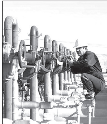
استان اشاره و اضافه کرد: در این ارتباط، ۳۷ واحد صنعتی در آزادشهر، ۱۰۷ واحد در آق قلا، ۵۷ طرح در بندرگز، ۲۵ طرح در بندرترکمن گازرسانی شده