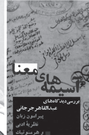
بررسی دیدگاه های عبدالقاهر جرجانی

ضمن تبریک برای چاپ و انتشار کتاب ارزشمند «آسیمه های معنا»، پرسش اول این است که چه چیزی در عبدالقاهر جرجانی به عنوان یکی از بزرگان و اندیشمندان حوزه بلاغت جهان اسلام و ایران، برای شما که منتقد و شاعری با گرایش مدرن هستید جذاب بوده که دست به این پژوهش بزنید؟ در درجه اول همه کسانی که با ادبیات سرو کار دارند می دانند که عبدالقاهر در نزد ما با القاب خاصی مانند امام النحو و پدر معانی و بیان شناخته می شود و تالیفات زیادی در این زمینه دارد، جدای از اینکه من اهل منطقه گرگانم و عبدالقاهر هم با افتخار یک گلستانی است و در گرگان قدیم نشو و نما پیدا کرده و این طور که تاریخ می گوید هیچ وقت از آنجا خارج نشده، تمام استادانش همین جا بودند و شاگردانش را همین جا پرورش داده است و بنیان هایی که ادبیات ما را می سازد بخش بزرگی مدیون جرجانی است، از سوی دیگر وقتی درباره ادبیات صحبت می کنید نمی توانید بگویید این ادبیات سنت است یا مدرن یا کلاسیک. چون نظریه ادبی نه سنت است نه مدرن، نظریه ادبی نوع نگاه و اندیشه ورزی یک انسان یا مکتب و سبک، نسبت به عناصر پیرامونی و اصلی و بنیان های ادبیات است. این نظریه قرن ها می تواند استفاده شود و مورد رجوع و پژوهش قرار بگیرد. نمونه آن بوطیقای ارسطویی است که قرن هاست در بین اندیشمندان و نظریه پردازان ادبی مطرح بوده، خروج هایی از بوطیقا انجام شده و پیوسته هایی به آن زده شده و خیلی ها از جمله ساختارگراها و فرم گراها و حتی مکتب هایی که به شدت به روز و مدرن هستند، از آن استفاده می کنند به عنوان نمونه دستور زایشی، نوام چامسکی که بعضی مولفه هایش را از بوطیقای ارسطویی می گیرد و خود می داند که بوطیقا از کهن ترین نظریه های ادبی است.