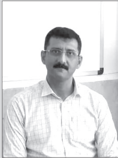
اگر هویت ملی ضعیف شود و یا از بین برود، همبستگی اجتماعی نیز کمرنگ می شود و کشور در برابر تهدید های داخلی و خارجی، ناتوان می شود.

■ آیا ملی گرایی مضراتی هم دارد؟ در تعریف ملی گرایی بسیاری اعتقاد دارند که ملی گرایی یعنی احیا هویت در سرزمین های دیگر و شناخت هویت ما توسط دیگران. اما گروهی دیگر، ملی گرایی را نفی دیگر هویت ها معنا می کنند و به صورت افراطی دیگران را تحقیر می کنند. در این رابطه می توان آلمان نازی را مثال زد که باعث شکل گیری جنگ جهانی دوم شد و جنایت های بسیاری هم شکل گرفت. در زمان رضا شاه نیز ما شکلی از ملی گرایی افراطی را شاهد بودیم و در نتیجه آن تهدید دیگر اقوام را شاهد هستیم. در نتیجه ملی گرایی تا زمانی می تواند مفید باشد که یک ملت را در تعارض دیگر کشور ها قرار ندهد و افراد به ملیت خود افتخار کنند و برای رشد آن تلاش کنند.