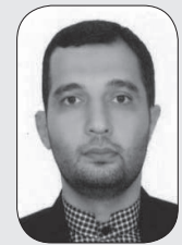
■ محمد انصار

شرح حال علما و ادبای استرآباد، نام رساله‌ایست که در سال ۱۲۵۶ (۱۲۹۴ ق)، به قلم شیخ محمد صالح استرآبادی نوشته شد. نخستین بار، این پژوهش در کتاب گرگان سرزمین طلای سفید (تألیف مسیح ذبیحی) و سپس با همکاری ایرج افشار و محمد تقی دانش پژوه در کتاب استرآبادنامه به چاپ رسید. همچنین بار دیگر، در سال ۱۳۸۶ به کوشش انتشارات امیرکبیر چاپ شد. سالهاست که از آخرین چاپ آن، می‌گذرد و به سختی می‌توان آن را بدست آورد. اما نسخه الکترونیکی دارد که می‌توان از آن، بهره گرفت. نگارش این رساله، برای پاسخگویی به درخواست ناصرالدین شاه