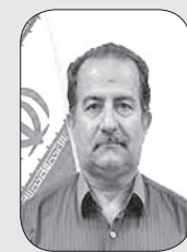
■ دکتر حسین میفانی

بخش آخر - در شیعه حکیمی چون ملاصدرا در نظام حکمت متعالیه اش کوشیده است پابندی به تصوف (یا عرفان) و فلسفه و شریعت (یا فقه) را یکجا جمع کند و از این جهت سرورش را می توان ادامه دهنده مدرن حکمت صدرایی دانست. مشکلی که ملاصدرا و سرورش، هر دو بدان مبتلایند و از پاسخ بدان طفره می روند آنست که چگونه ممکن است تجارب انفسی عرفانی جای استدلال و ارائه ادله بین الادهانی فلسفی را بگیرند؟