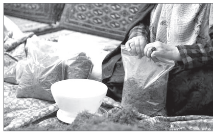
تعداد تسهیلات دریافتی مددجویان مشاغل خانگی کمیته امداد امام خمینی (ره) از مجموع تسهیلات قرض الحسنه پرداختی این بانک بالغ بر یک هزار و ۹۵۴ فقره

به ارزش ۵۹۹ میلیارد و ۸۱۰ میلیون ریال و تسهیلات خوداشتغالی مددجویان بهزیستی بالغ بر ۲۹۱ فقره به ارزش ۱۰۲ میلیارد و ۸۷۰ میلیون ریال بوده است. بانک ملی ایران همچنین طی این مدت ۳ میلیارد و ۲۰۰ میلیون ریال نیز تسهیلات برای ایجاد و توسعه مشاغل خانگی به مددجویان بنیاد شهید تخصیص داده شده است. افزون بر این پرداخت یک میلیارد و ۸۵۰ میلیون ریال تسهیلات به متقاضیان و صاحبان مشاغل که از سوی وزارت تعاون، کار و رفاه اجتماعی معرفی شده اند از دیگر اقدامات بانک ملی ایران در مدت مذکور در راستای حمایت از بازار کسب و کار و مشاغل خانگی بوده است.