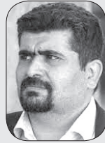
■ شبیر دائمی

روابط عمومی یک فرایند ارتباطی استراتژیک است که شرکت ها، افراد و سازمان ها را برای ایجاد روابط سودمند با یکدیگر بهره مند می کند نقش مهم و برجسته ای در برخورد با مخاطبان یک سازمان یا مؤسسه دارد. در این راستا روابط عمومی ها به عنوان حلقه ارتباطی بین سازمان و جامعه نقش بسیار مهمی دارند، هرچه این حلقه ارتباطی گسترده تر و محکم تر باشد، به همان اندازه سازمان در پیشبرد اهداف و فعالیت های خود موفق تر خواهد بود. پس روابط عمومی ها برای اینکه بتوانند این حلقه ارتباطی سازمان را با جامعه حفظ کنند، باید در جستجوی تکنیکها، الگوها و شیوه های مناسب و جدید باشند. یکی از این شیوه ها و الگوها خلاقیت و نوآوری است که عامل مهم موفقیت برنامه های روابط عمومی است که اگر بدرستی بکار گرفته شود، بسیاری از ضعف های فنی و اجرایی را پوشش می دهد و چون حوزه فعالیت روابط عمومی از تنوع و حیطه بالایی برخوردار است، امکان ظهور خلاقیت در آن به مراتب بیشتر از سایر حوزه های کاری سازمانها است. روابط عمومی کارآمد و پویا به طرز بسیار شگفت انگیزی به خلاقیت و نوآوری کارشناسانش وابسته است و اگر زمینه