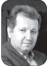
■ مهرا ن دالوندی

جغرافیا و توپوگرافی شهرستان گنبد به شکلی است که به علت عدم وجود شیب نیازمند توجه ویژه جهت نظافت می باشد.