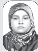
● آیه سوخته سرایی. ۵ساله

روزی روزگاری در جنگلی زیبا و سرسبز روباهی مکار و گرگی دانا به همراه بقیه ی حیوانات زندگی میکردند. روزی از روزها، روباه مکار که حیوان تنبلی بود رفت تا حیوانات را گول بزند و بترساند تا آنها را وادار کند که برایش کار کنند. روباه به سراغ خرگوش رفت. خرگوش حیوان زیرکی بود، او تا فهمید روباه مکار به سراغش آمده ترسید و فرار کرد و پیش گرگ دانا رفت و به او گفت: ای گرگ دانا چه کار کنم که از شر روباه بدجنس خلاص شوم و حیوانات جنگل را از دست روباه مکار نجات دهم؟ گرگ دانا کمی فکر کرد و گفت: من ببر قوی و نیرومندی را میشناسم که میتواند روباه را از جنگل بیرون کند. اما...خانه ی ببر خیلی دور است. خرگوش گفت: مشکلی نیست من خیلی چابک هستم و زود ببر را پیدا میکنم. خرگوش به راه افتاد و به سمت خانه ی ببر حرکت کرد. چند روز بعد به غاری رسید که ببر در آن زندگی میکرد. خرگوش وارد غار شد و صدایی شنید، صدا را دنبال کرد و ببر را دید که مشغول غذا خوردن است. جلو رفت و سلام کرد. ببر با دیدن خرگوش گفت: چه کسی تو را پیش من فرستاده؟ خرگوش گفت: گرگ دانا من را فرستاده، از تو میخواهم که همراه من بیایی و بعد ماجرارا برای ببر تعریف کرد. ببر با شنیدن حرفهای خرگوش بلند شد، گفت: راه بیفت باید هر چه زودتر به آنجا برسیم. وقتی به جنگل رسیدند، ببر به سراغ روباه رفت و خرناسی کشید و گفت: تو دیگر حق نداری حیوانات را اذیت کنی! روباه که خیلی ترسیده بود پا به فرار گذاشت و برای همیشه از آنجا رفت. گرگ دانا و خرگوش زیرک از ببر تشکر کردند. ببر از آنها خداحافظی کرد و از آنجا رفت. سرانجام، حیوانات جنگل به خوبی و خوشی در کنار هم زندگی کردند.