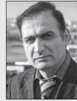
عباس فرهادی لوکال

ممال را در لغت به "برگردانده شده، خم شده، میل داده شده و" از مصدر اماله معنا کرده‌اند؛ مثلاً ممال واژه‌ی "اسلام" می‌شود "اسلیم" که به شکل صفت نسبی امروزه در هنرهای نگارگری "اسلیمی (=اسلیم+ی)" کاربرد دارد.