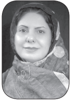
سریا داودی حموله

دیلمت به چیدن نمک گل سرخ بر متن سپید! با همین زخم‌ها بر خطوط مورب دست چه طالع شوری گل سرخ بر متن سپید! برمی‌گردی با کاسه‌های واژگون چاشت، از سبزینه‌ی شوراب آه!