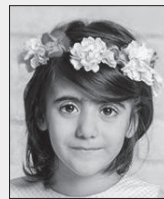
■ سیرا شهوری

اصطلاح معروف «چهارپایی بر او کتابی چند» را شنیده‌اید؟ مصرع‌ای از سعدی است. با هم حکایتی کوتاه از گلستان سعدی را بخوانیم. هرچند باب هشتم کتاب گلستان سعدی به موضوع «در آداب صحبت» اختصاص دارد؛ حکایت شماره سه تا حدودی در مورد آدم‌هایی است که کتاب زیاد دارند ولی عملاً چیزی نخوانده‌اند و درکی از مفاهیم ندارند. یا بعضی افراد هم شاید کتاب‌های زیادی بخوانند و حتی مدارک تحصیلی بالایی هم داشته باشند؛ اما رشدی از لحاظ شعور و هوش اجتماعی و عاطفی ندارند. سعدی اینگونه افراد را مانند چهارپای بارکشی می‌داند که بارش کتاب است ولی از محتویات کتاب چیزی نمی‌فهمد. گاهی وقت‌ها تصور بر این است