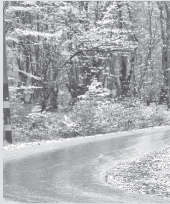
به طور قطع باید درختان بومی را مدنظر قرار دهیم بیطهای محدود مثل پارکها، بوستانها و فضای مدارس در دهی درخت مورد توجه است، انجام گیرد

۲۰- درخت یکی از هزاران نعمت های الهی و از عناصر مهم در محیط زیست به حساب می آید و اثرات مثبت آن بر پاکسازی هوا، جلوگیری از فرسایش خاک، کاهش گرمای زمین و همچنین استفاده از چوب و دیگر محصولات آن همه نشان از اهمیت بسزای درخت در ابعاد مختلف زندگی انسان دارد. با توجه به اهمیت درخت و نقش آن در حفظ سلامت محیط زیست، ۱۵ اسفند به عنوان روز درختکاری نامگذاری شده است. درختان، مواد غذایی، سوخت، مصالح ساختمانی، مواد معدنی و دارو را به ما عرضه می کنند. آنها همچنین برای بسیاری از پستانداران، پرندهگان، بی مهرگان، خزه ها، قارچها و... پناهگاه و خانه تامین می کنند. آنها دی اکسید کربن را جذب و اکسیژن را آزاد کرده و از فرسایش خاک جلوگیری می کنند. رطوبت خاک را حفظ کرده و تا چند درجه گرما و حرارت هوا را پایین آورده و رطوبت نسبی هوا را افزایش می دهند. به طرز چشمگیری در حفظ تعادل آب و هوا کمک می کنند. اما با افزایش جنگل زدایی در معرض تهدید قرار گرفته اند. برای مقابله با اثرات مخرب این جنگل زدایی، بایبید در برنامه و پویش برای زمین درخت بکاریم که توسط ادارات کل منابع طبیعی استانها هر ساله برگزار می شود، شرکت کنیم.