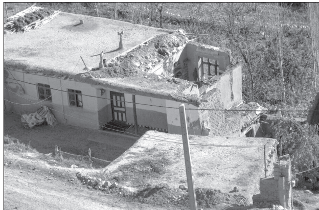
روستایی این استان را برچید.

هم اکنون شاخص نوسازی خانه‌های روستایی گلستان ۵۷ درصد و میانگین کشوری آن نیز ۵۰ درصد است