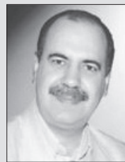
■ عظیم قرنجیک