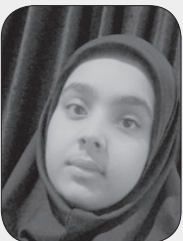
■ فاطمه زهرامیری

می دانم. می دانی. می دانند... دوست دارم دوباره سفر کنم، اما سفری ساده نه، سفری که خیلی ها آرزوی رفتن به آنجا را دارند. او مرا دعوت کرده است. خیلی خوشحالم این فرصت نصیب همه نمی شود. دوست دارم هرچه سریع تر به مقصد برسم. آماده بشوم و به دیدن او بروم. سرم را روی پنجره فولادش بگذارم و دعا کنم. تا بحال نشده که آتش چیزی بخوام و مرا بی جواب بگذارد. مطمئنم که به دعاها هم آنقدر زود جواب می دهد، چون او دل مهربانی دارد. او آنقدر دل رحم است که حد ندارد. این دفعه می خواهم دعا کنم برای دوستانم، خانواده ام، مردم که هرچه زودتر هر مشکلی دارند، حل بشود. راستی می دانی نامش چیست؟ مطمئنم که می دانی. منظورم آقا امام رضا بود. می دانم تو هم از این سفرها دوست داری و دلت برای پنجره فولادش تنگ شده. می دانم که نصیب تو هم می شود. پس امیدوار باش! می دانی که او خیلی سرش شلوغ است ولی کسی را از یاد نمی برد! مطمئن باش!