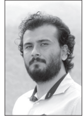
■ علی درزی

حمید نعمت الله را می توان یکی از خروجی های بسیار مسعود کیمیایی دانست که به سینمای ما معرفی شده. نعمت الله را به خاطر وضعیت سفید ستایش می کنم. سریالی شلوغ به سبک امیر کاستاریکا اما کاملا ایرانیزه شده، با شخصیت پردازی های نوآورانه، کلیشه شکن و قصه ای جذاب در دل خرده پیرنگها! او بعد از دستیاری کارگردان و نویسندگی، خودش را با بوتیک به سینما معرفی کرد. فیلمی متفاوت که برشی متفاوت به اجتماع جوان آن زمانه داشت و بعدا هم با بی پولی قدرتش را در تنوع ژانر نشان داد و با آرایش غلیظ هم این تنوع را به حد اعلا رساند. خون کیمیایی در رگ های نعمت الله جاریست و رد این خون را در همه کارهای او می توان دید. نه در حد اینکه با چاقو و رقیق فیلم بسازد اما ادای دینش همیشه قابل اشاره است. (اگر چه به نظر من تأثیرش بیشتر منفی است تا مثبت)