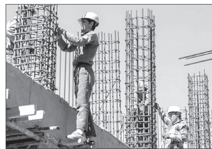
در قالب بودجه متمم برای افزایش سقف تسهیلات این واحد از ۱۰۰ به ۲۰۰ میلیون تومان اختصاص و ابلاغ

شده که در حال کارسازی است. حسینی بیان کرد: در طرح نهضت ملی مسکن برای چهار سال، ساخت ۲۸ هزار منزل مسکونی (هر سال هفت هزار واحد) برای گلستان پیش بینی شده که در سال نخست این طرح، ساخت هفت هزار واحد آن با تسهیلات قرض الحسنه یک میلیارد ریالی شروع شده است. وی اضافه کرد: امسال هم ابتدا سهمیه گلستان برای ساخت هفت هزار واحد مسکن در روستاها و شهرهای کمتر از ۲۵ هزار نفر سهمیه پیش بینی شد که این رقم با پیگیری استاندار به ۱۱ هزار واحد افزایش یافت و علاوه بر آن تسهیلات قرض الحسنه پیش بینی شده امسال هم از یک میلیارد ریال به دو میلیارد ریال افزایش پیدا کرد.