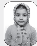
■ فاطمه خاندوزی

یکی بود یکی نبود. در یک جنگل زیبایی خیلی قشنگ که درختان بلند و سرسبز با چترهای بزرگ وجود داشت، پسری به نام کیان به همراه پدرش که جنگلیبان زحمتکشی بود، زندگی می‌کرد. در زیر درخت بلوط بزرگی یک خرس قهوه‌ای مهربان لانه داشت و در کنار رودخانه، خرگوش سفید و خوشگلی زندگی می‌کرد که چشمهایش مثل ستاره‌ها می‌درخشیدند. کیان و پدرش هر روز از خرگوش مواظبت می‌کردند، چون روباه دروغگو همیشه بی‌صدا در کمین خرگوش بود تا او را شکار کند، اما حضور کیان و پدرش باعث می‌شد که روباه شکست بخورد و خرگوش در آن جنگل به همراه حیوانات زندگی خوبی داشته باشد.