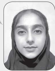
■ نیایش پودینه‌ئی

حالا مدت هاست که ملادینا دلفینی را از دریا، خانواده و دوستانش جدا کرده و به محل نگهداری از دلفین‌ها منتقل کردند. با خود فکر می‌کند که شاید اینجا چندان بد نیست؛ ولی سخت است که تو را از عزیزانت و محل زندگی ات جدا کنند و به محل غریبی ببرند که نمیشناسی. ملادینا دلفینی روزی هزار بار آرزو دارد که به اقیانوس‌ها و دریاها سفر کند و تمام تلاشش را می‌کند که از اینجا آزاد شود. بازتاب تصویر خود را زیر شعاع آفتاب روی فلز دیواره‌ها می‌بیند و به خود می‌گوید: «اینجا زندانبست برای من، من روزها و روزها تلاش می‌کنم اما چون تنها هستم، نمی‌توانم از اینجا بیرون بروم». دخترکی آمده است به دیدارش! انگار مهربان به نظر می‌رسد؛ ملادینا دلفینی تا حدودی حرف انسان‌ها را متوجه می‌شود و معنی نگاه‌ها و لبخندها را درک می‌کند. مثلاً فقط کافی است چند ثانیه به چشم کسی نگاه کند تا نظر انسان را در مورد خودش بفهمد. او متوجه شد که دخترک، زبان دلفین‌ها را می‌فهمد و آنها را درک می‌کند. کمی از ته قلبش خوشحال شد. لبخندی زد و با خودش گفت: «این دخترک کلید آزادی من است».