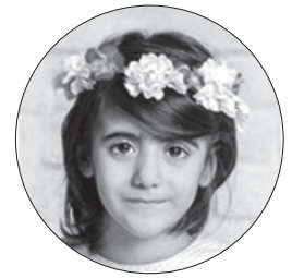
● سیرا شهوری

خرس کوچولو در مدرسه تنها بود و هیچ دوستی نداشت. همه مسخره اش میکردند و همه با خرس کوچولو دعوا میکردند. اما خرس کوچولو با همه مهربان بود. هر موقع به مدرسه می رفت یه بچه قلدر می آمد و او را می زد و هل میداد و خرس کوچولو زمین میخورد. یک روز در راه از مدرسه می رفت که یک بچه گربه را دید پایش زخمی شده بود. آن را به خانه برد و ازش مراقبت کرد. بچه گربه حالش خوب شد و خرس کوچولو بچه گربه را پیش مادرش برد. مادر بچه گربه از او تشکر کرد. خرس کوچولو با خودش گفت چقدر خوب است که من هیچکس را نمی زنم و با همه مهربانم، اما بقیه با من بد هستند. یک راهی در فکرم هست تا بتوانم همه را با هم مهربان کنم. اسباب بازی های جورواجور بخرم یا درست کنم یا از بقیه فرار کنم و دور باشم. او به همه اسباب بازی های بامزه داد همه با او مهربان شدند، اما بچه بد می خواست خرس کوچولو را اذیت کند، هیچ چیز خرس کوچولو را هم نمی خواست. اون بچه قلدر آماده شده بود برای زدن خرس کوچولو. آن خرس مهربان شده بود، نمی خواست کسی را بزند، خرس کوچولو فقط میخواست از خودش دفاع کند. یا فرار کند یا یک سپر بگیرد و در آخر آن بچه قلدر را شکست داد و پیروز شد. درس عبرتی برای بچه های قلدر شد تا دیگر کسی را اذیت نکنند. همه شاد شد در کنار هم زندگی کردند. خرس کوچولو با همه مهربان شد در مدرسه همه را دوست داشت و دلش میخواست زحمات خانم معلم را جبران کند. او باسواد شده بود، می توانست بخواند بنویسد. خرس کوچولو به استرالیا رفت تا در آنجا زندگی کند. در آنجا همه شاد هستند حیوانات بامزه ای زندگی می کنند. او همسایه ی کوئو کا شد، کوئو کا خوش اخلاق ترین حیوان دنیا است. همسایه های خرس کوچولو برایش غذا بردند. آنجا هوا دل انگیز است.